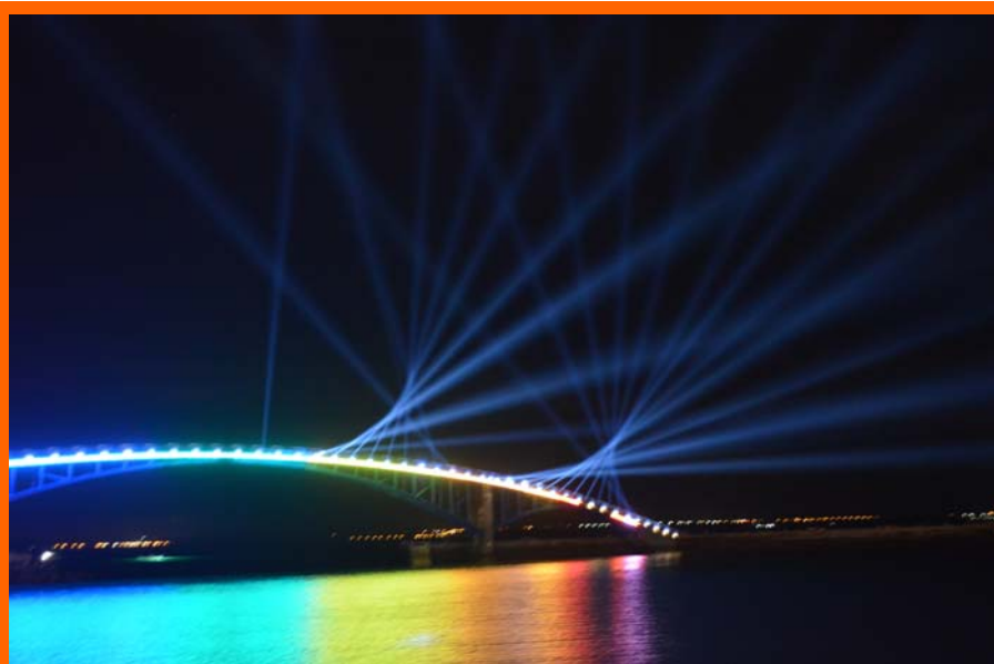
彩虹橋燈火秀

政府從92年起，每年必定舉辦的盛大節日。澎湖花火節雖不是吸引旅客來菊島觀光遊玩的唯一誘因，卻是夏季菊島夜空裡，最令人期盼的夜空景色。澎湖花火節的由來，乃因在91年5月25日，在澎湖外海海域目斗嶼北方約10海浬處上空發生重大空難「華航空難」，此事故直接或間接重創了澎湖的觀光產業，澎湖當地不論是航空業、飯店住宿業或是餐飲業者，都受到波及。因此澎湖縣政府為了提振當地觀光產業，該年與中華航空公司合作舉辦「千萬風情在菊島」活動，在當年農曆七夕當天掀起一波高潮。因91年活動的成功，隔年澎湖縣政府再與多家航空、船運公司及民間業者共同合作，正式舉辦第一屆92澎湖海上花火節，並將活動地點移至觀音亭舉行，邀請歌手、表演團體演出，再搭配高空煙火秀，將入夜的澎湖夜空點綴得五彩繽紛，燦爛奪目！每年夏季在菊島舉辦的海上花火節，遂成為澎湖夏季盛會之一，也是吸引旅客在夏季期間來訪菊島，最令人難以忘懷的夜空景色。