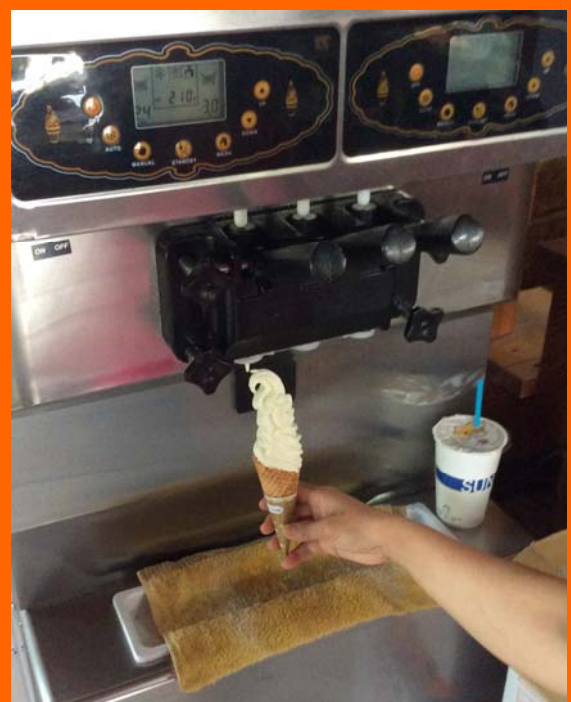
新產品羊乳霜淇淋值得一嚐

春天來臨，恆春分所的小羊陸續出生，欣喜新生命到來的同時，牧場也開始進入羊乳盛產時期。今年合作社突發奇想，決定搭上目前熱門的霜淇淋消費熱潮。市面上的霜淇淋多為牛乳製作，因此本分所嘗試以羊乳製作霜淇淋，期望特殊而濃郁的風味能成為產品特色，因此決定於4月中之後進行試賣。炎夏將至，想要清涼一下嗎？一般風味的霜淇淋已經無法滿足您了嗎？市面羊乳霜淇淋很少見，值得一嚐！歡迎試試看恆春分所合作社羊乳霜淇淋，讓稀有的食材及獨特的風味開拓您對霜淇淋的視野。