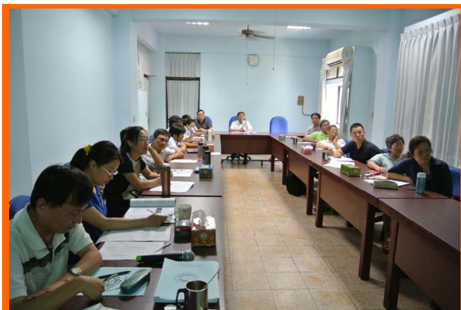
芻料作物學術研討會會場

在牧草價格調整事宜及未來研究目標之規劃，提升乾草品質，積極推動分級制度，後續才能合理提高牧草售價。另因應市場考量推出牧草新品種，新的耕作與調製模式，以提高國產芻料之生產量。