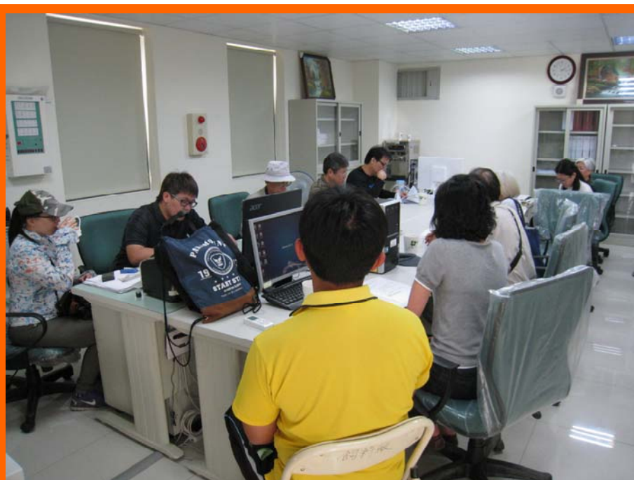
綠建築標章申請案的查核會議

本所飼料廠屬公務機關新增設之建築物，雖然是工廠重地，依規定仍需要取得綠建築標章，表示整廠設計有充分的節水、節能與植栽綠化等規劃。在新飼料廠設計規劃階段已含括綠建築的申請，申辦手續委由鄭裕欽建築師事務所負責辦理。本案由事務所準備相關的申請文件，向財團法人臺灣建築中心