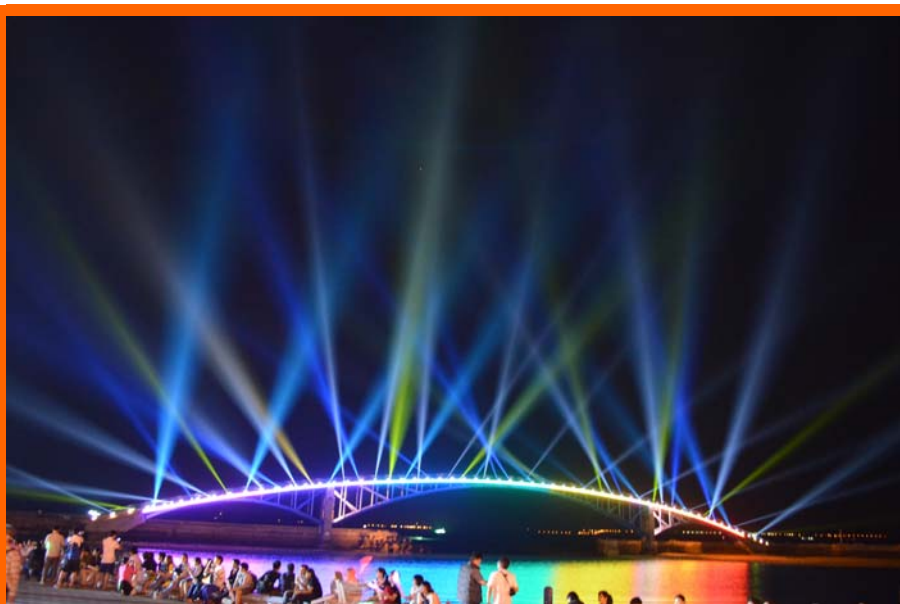
彩虹橋燈火秀

4月20日是享譽盛名的澎湖國際海上花火節開幕日，當天筆者到活動現場，親身體驗花火節的熱鬧和美景，果真名不虛傳，現場人山人海，大家席地而坐，一邊家人朋友閒話家常，一邊欣賞彩虹橋的燈光美景和現場熱鬧的表演，令筆者印象深刻。花火節為澎湖縣