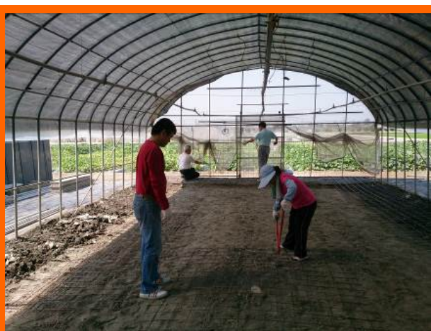
復興基地同仁利用溫室改建大棚式鵝舍