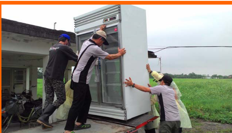
辛勤的壯丁們協力搬運儲蛋冰箱至新的孵化室

在這個恰似後母臉的春末季節，禽流感的疫情雖隨氣溫漸暖而逐漸趨緩，但仍不能掉以輕心，防範於未然才是我們最終追求的目標！