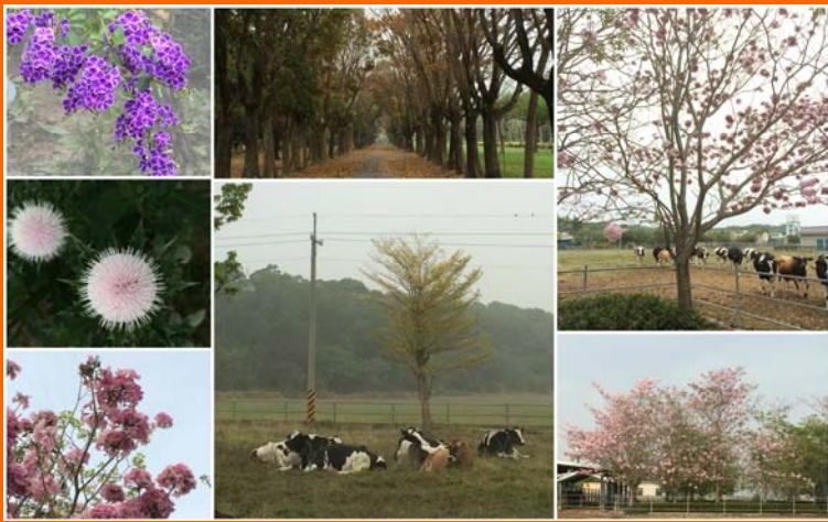
畜試美景

在畜產試驗所工作，最大的幸福就是被這一大片自然美景包圍，且一年四季都有不同的景緻。由於產業組的位置，座落於畜產試驗所最裡面，每日早晨上班從進畜產試驗所大門起，一路到辦公室，可以沿路欣賞美景、吸收大自然芬多精，開開心的上班；下班時，也同樣的看著這美麗的景緻來消除疲勞，一整天下