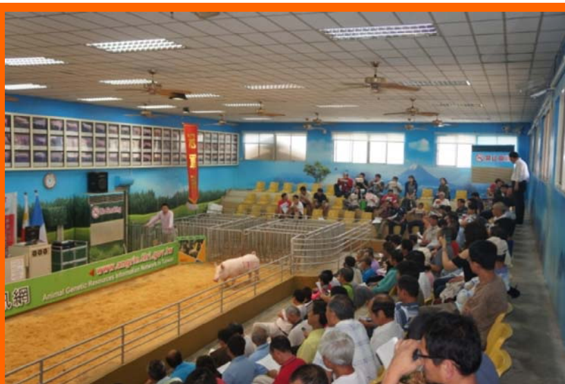
參觀種豬拍賣活動

本所今年訓練班由4月21~23日所舉辦的「種豬性能檢測及基因選種進階選修班」揭開序幕，緊接著還有9班訓練班將陸續開辦。本訓練班參訓學員是來自各個不同的養豬場，課程除安排專業課程之外，另特別配合安排參觀種豬拍賣現場，讓學員能親自感受拍賣現場的拍賣過程及氛圍。課程內容有種豬生長性狀之檢測技術、種母豬配種哺乳性狀之檢測技術、種豬拍賣經驗分享、種公豬產精性狀檢測技術—採精驗證、種豬基因檢測技術—肉質與產精基因、種豬血統登錄—登錄檢定要點、種豬拍賣現場觀摩等課程，內容豐富結訓時，學員皆表示參與此訓練班受益良多，並肯定本所安排此次訓練班的用心。