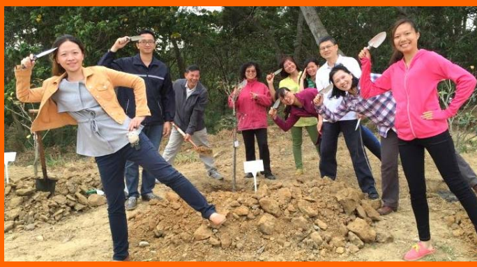
加工組同仁於後山農塘旁參與植樹活動

今年跑到後山的農塘來完成一年一度的植樹日，筆者第一次參加這種活動，感覺莫名的興奮。原來幫忙種樹還有精美小禮物可以帶走，聽到有薰衣草可以領取，旁邊有位女性同仁，二話不說，立馬拿起鏟子直撲那些要種植的七里香，不過大家都太厲害了，為了這精美小禮物，瞬間農塘旁蹲滿了人群，依這種幹勁，不用半小時植樹活動就可以圓滿落幕了。