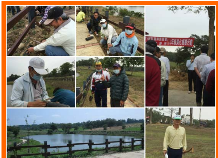
產業組同仁開心種樹趣

今年的綠美化植樹活動，於4月8日在後山農塘環潭步道周邊舉行。農塘乃所內滯洪池，蓄水防洪設施之一，不僅可提供牧草區灌溉用水，於雨季時也可以發揮滯洪功效，是水土保持重要一環，同時也成為後山美景，是大家下班後休閒好去處。此次植樹活動，飼料作物組準備了七里香及煙火樹，一個清香淡雅，一個繽紛美麗，可為農塘添美又增香，員工消費合作社也提供實用紀念品（園藝小鏟子），完成植樹後，還可以憑5個塑膠苗盆換取薰衣草苗或迷迭香苗一盆。