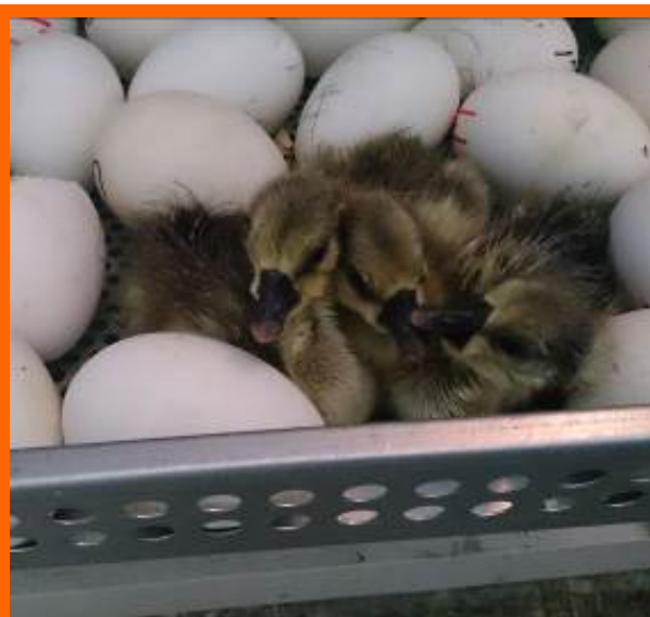
異地飼養出雛之北斗褐鵝畜試壹號

雖然本場受到如此沉痛的打擊，但挫折只是一時的灰暗，只要「火種未熄、信念尚在」，光明的前景仍然在望！本場是我國唯一的養鵝研究機關，除了研究與推廣之外，也肩負培育珍稀鵝種的任務。在經過防檢局召開專家會議協商之後，決定要將北斗白鵝畜試壹號（本土白羅曼鵝）、貳號（白色華鵝）、北斗褐鵝畜試壹號（褐色華鵝）及黑天鵝等場內培育多年的珍稀種原保存下來。雖然有了可以努力的方向，但馬上就面臨到異地孵化及飼養的場地問題，原本異地保存在北斗鎮農會的種蛋，隨著時間的增加，孵化率下降的風險也漸漸提高，因此異地孵化準備的速度一刻也不能耽擱。在此真的要十二萬分感謝臺中區農業改良場林學詩場長、白桂芳課長及所有同仁的協助，林場長在接獲本所黃英豪所長的電話時，不僅一口答應幫忙，後續並通令該場所有同仁，在各方面依本場所有的需求提供支援，讓本場有個重新站穩腳步的起點。在順利取得復興基地之後，同仁們竭盡所能，只用了 1 個星期的時間，就完成了孵化機的設置，