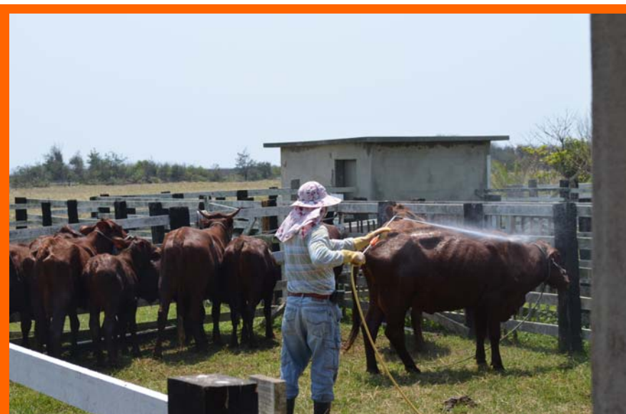
牛隻體外驅蟲

夏季快到了，現場飼養牛隻的聰哥趁著舒適的天氣，進行場內牛隻的體外驅蟲，牛隻的外寄生蟲，主要有牛壁蝨和疥癬蟲兩大類，牛壁蝨會造成牛隻皮膚刺咬受傷感染、貧血、營養不良等；疥癬蟲則是造成牛隻皮膚組織發炎腫脹與組織液滲出，滲出液乾燥後形成皮屑，