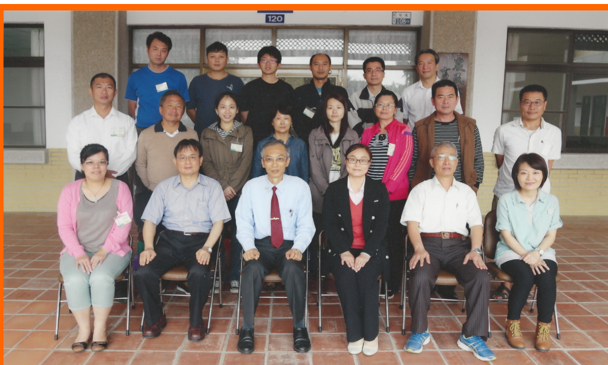
行政院農業委員會畜產試驗所 104.4.21-23 104年農民學院「種豬性能檢測及基因選種進階選修班」合影