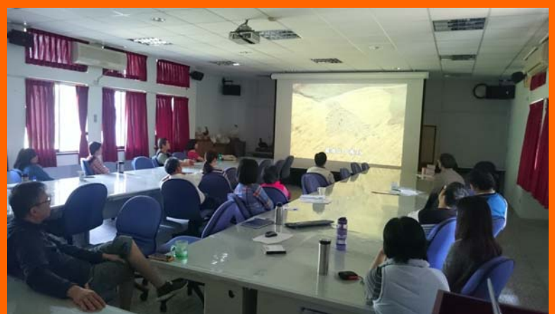
大家暫緩手邊工作一同思索地球的未來

看完影片，不禁讓我們反省地球只有一個，如果現在不能夠節約能源的使用，地球的命運將會在我們手中終結。