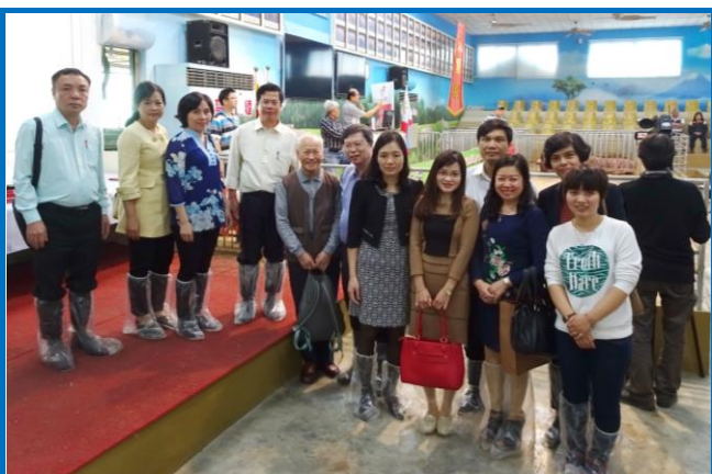
越南畜牧局官員參訪種豬協會種豬拍賣活動

全球化的世界，愈來愈多的國際交流活動如火如荼地進行著。臺灣的種豬產業以領先世界的腳步奔馳著，而越南近來也是積極發展其畜牧產業。