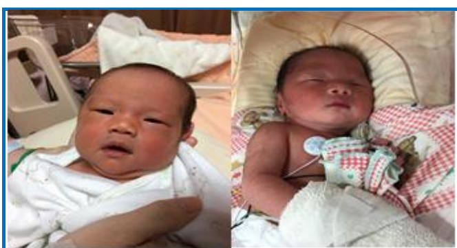
左：姊姊；右：弟弟

恭喜本組康定傑助理研究員夫婦於1月2日喜獲一對兒女，康定傑與以前同服務於本所遺傳育種組的邢湘琳結婚多年，終於在新年第二天順利產下龍鳳胎，姊姊體重 2,668 公克，弟弟 2,616 公克，兩個寶寶與媽媽都平安健康。隨著寶寶的誕生，康定傑終於可以擺脫被同事開玩笑，自己做生殖生理研究怎麼會生不出來