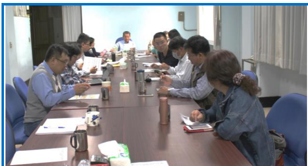
科技計畫期末審查會過程

去（105）年度「牧草、飼料生產及品質改進」及「優質乾草產業化關鍵技術開發（多年期競爭計畫）」（本所自辦部分）子項科技計畫期末審查會議於12月22日上午10時，假本組三樓會議室召開，此次審查會由行政院農業委員會畜牧處主辦，針對今年度研究計畫及內容作實質審查及建議交流。