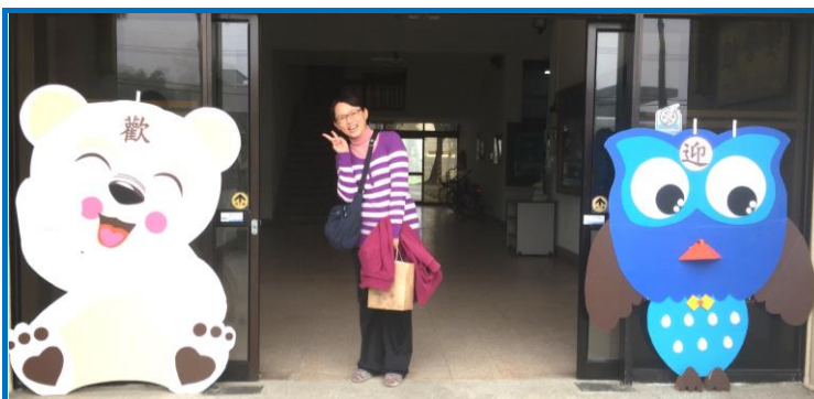
與經營組歡迎玩偶合影

懷著忐忑不安的心情，1月3日正式來到經營組報到，從加工組出發前，文賢組長貼心提醒我第一天過去要開心迎接未來，讓新單位留下好印象，整個很像嫁女兒的心態害我又差點感傷起來；走往經營組的路上遠遠就看到兩個可愛的大型玩偶