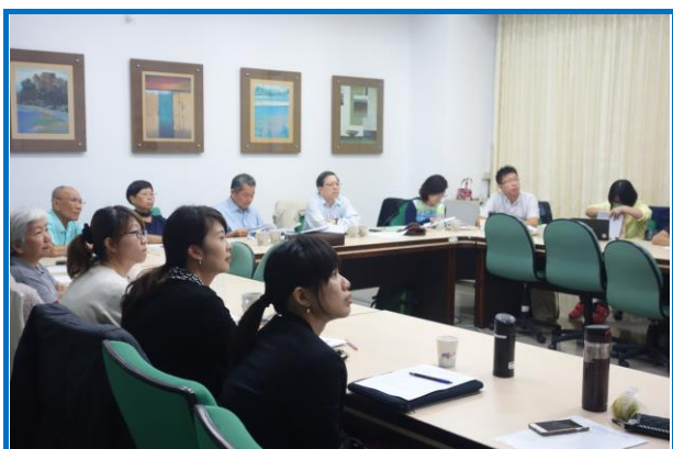
105年飼料營養期末審查

歲末年初，大家的壓力都特別大，連12月31日開著電視看著台北101跨年倒數與煙火的興奮感都是輕淡淡的，因為要撰寫105年期末報告、效益評估與接受審查，緊接著又是106年研究細部計畫書提送，中間還需要努力爭取106年各種競爭型計畫（若不能成功，就只好成仁了）。