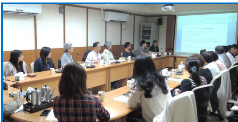
畜試所訊編輯會議

接辦後整個產業組總動員，也將此工作視為組內今年最重要的工作之一，林組長也期望組內參與的同仁以『沒有最好，只有更好』為目標，將 106 年度的所訊期刊辦得盡善盡美。