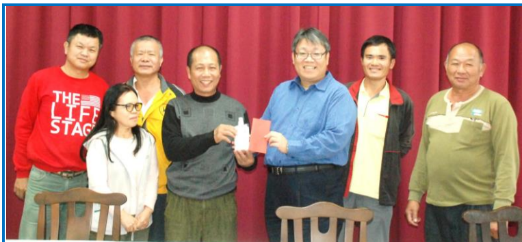
林場長頒發獲獎團隊獎金及獎品

活動自下午1點開始，正是當日天氣最舒適的時段，萬里無雲朗朗晴空，冬日暖陽微風輕拂，實在是戶外掃除的好天氣。參加人員分別由兩位主任帶隊，兵分兩路自大門起往左右圍牆外道路前進，部分路段因久未整理，雜木已經快長到了馬路中央，為敦親睦鄰，便