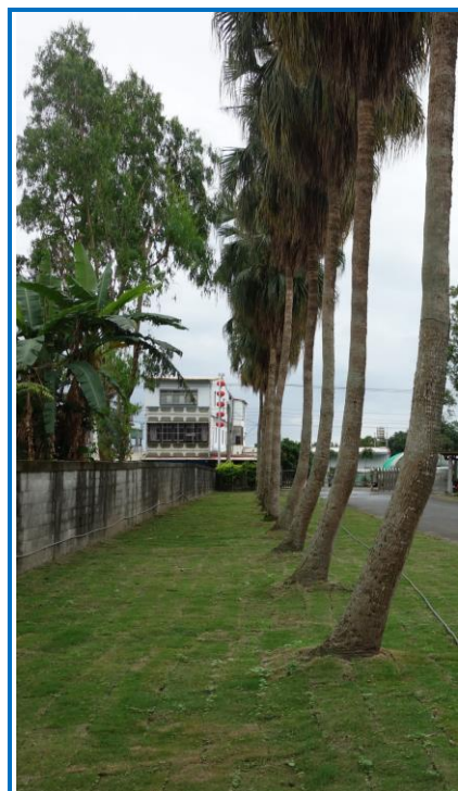
鋪植台北草

去(105)年12月26日時本場進行了環境改造，重鋪了車道兩旁及圓環的草皮。所選用的是質地細緻的台北草，其葉色翠綠，喜日照耐旱，草皮生長速度快，很適合臺灣的天氣。鋪植時有些小技巧，草皮與草皮間勿重疊以避免草皮黃化，約留一根手指頭寬度最佳；在新鋪的草皮上施加重量，力求草皮和土壤間之密合，並早晚澆一次水，使土壤保持濕潤即可。