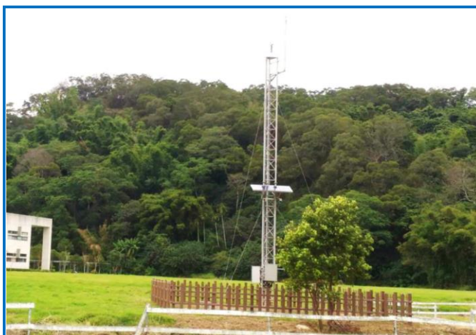
新竹分所農業氣象站全景遠眺

農業氣象站建置，包含觀測雨量、風向、風速、測站氣壓、氣溫、相對溼度、地溫及全天日輻射量等 8 項資料之感應器、無線資料傳輸設備、資料處理設備、GPS 校時裝置、太陽光電能源電源供應設備及防雷擊設備等，其他設備(氣壓儀、氣象資料記錄器、發射機、資料處理設備及蓄電池等)裝置於固定機箱內，氣象站觀測坪以風力塔為主體，使用螺旋槳風向風速儀作為