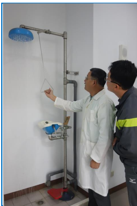
實驗室走廊的沖眼器測試

自去年底起，本所秘書室為因應職業安全衛生法的實施，大力推動相關提升職安的工作，督促同仁參加各類受訓、提送實驗室平面圖及藥品清單，並委託專業進行環境品質檢查及辦理相關講習等，大家都感受到莫大的壓力，但為達成提升工作同仁之職場安全，也都勉力且盡力配合。