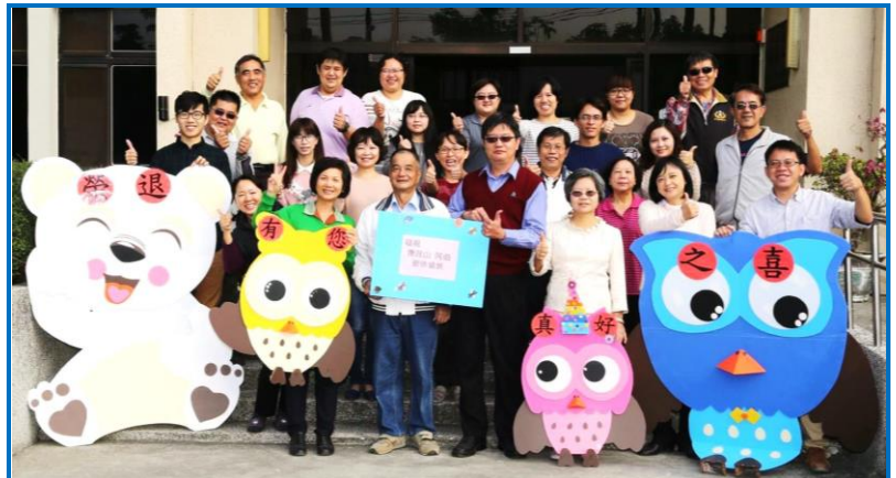
經營組全體同仁合影

其輔導的產業遍及豬、牛、兔、鵝、羊、駝鳥及鹿等，發表之學術期刊共53篇、研討會論文共51篇、專書及技術報告共66篇，並多次榮獲公務人員專書閱讀及心得寫作競賽第一及第三名。希望她退而不休繼續輔導產業，同時擁有愉快的退休生活!