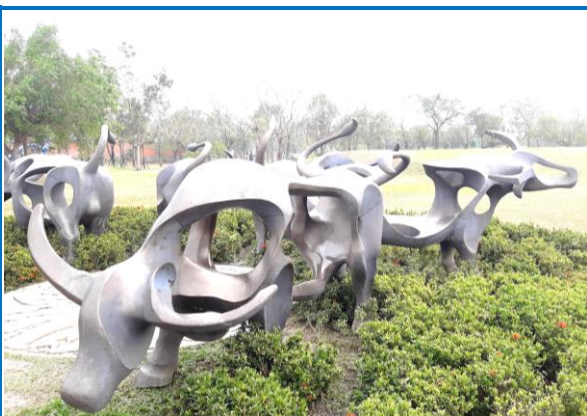
代表客家精神之水牛雕塑

不在高雄境內，緯度上與高雄市相同，但在行政區域劃分上屬於屏東縣內埔鄉。內埔鄉坐落於太武山腳下，各個族群都在此生活，其中客家居民約佔了六成以上。如果說北部桃竹苗是臺灣最大的客家聚落，那麼南部「六堆」內埔一帶應該是歷史最悠久的客家庄了。六堆指的是高屏一帶的右堆（高樹、美濃）、左堆（新埤、佳冬）、前堆（長治、麟洛）、後堆（內埔）、中堆（竹田）及先鋒堆（萬巒）。