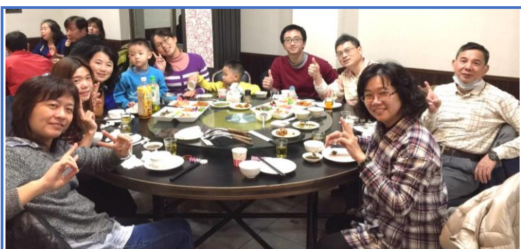
加工組尾牙聚餐

辛苦，於 1 月 25 日下班後假永康漁頭海鮮餐廳舉辦尾牙餐敘，除加工組同仁外，參與春節肉製品製作的外聘人員等均參加餐敘，大夥一邊品嚐著新鮮美味的海鮮料理，一邊聊著工作、生活的瑣事，飄散著濃濃的「年味」，好心情全都掛在臉上。本次的尾牙宴同時歡