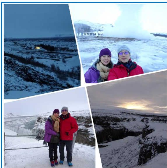
攝於民國 106 年 1 月 1 日， 上左為國會山國家公園、 上右為蓋歇爾間歇噴泉、 下左古佛斯黃金瀑布及 下右為 106 年 1 月 1 日冰島第一道曙光

2017 年 1 月 1 日，這天的行程是金環之旅及騎乘雪上摩托車，金環之旅是冰島熱門的景點，係指國會山國家公園（Þingvellir National Park）、蓋歇爾間歇噴泉（Geysir）及古佛斯黃金瀑布（Gullfoss, The Golden Waterfall）三個景點，首站為國會山國家公園，也是冰島古議會舊址，公園中的裂縫峽谷是歐美兩大板塊交匯處，為世界獨一無二的特殊景觀，其裂縫峽谷於 2004 年已列為世界文化遺產，到達時雖已是早上 10 點但天色昏暗猶如清晨天色微亮時分，這個季節的冰島日照時間約 2 至 4 小時，日出大約在上午 11 至 12 時，日落大約 14 至 15 時，所以每天的第一個景點，記錄在心裡及相機裡的通常是灰暗的，可惜這壯觀的景色我們卻無法品味細節。