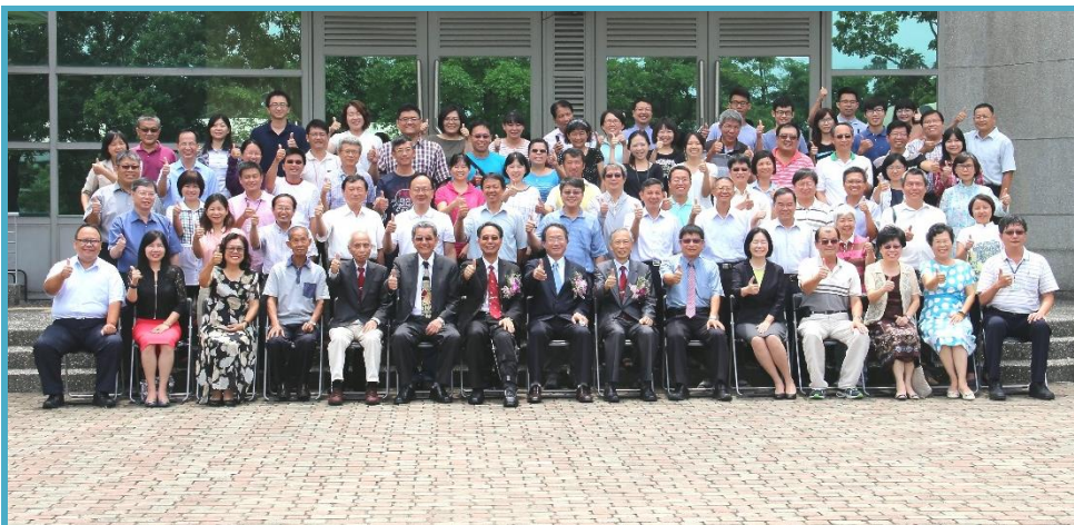
交接典禮後大合照

能協助產業界在豬隻育成率方面的進展。黃所長亦期勉各主管有洞察未來產業趨勢、經濟社會變動等因素的能力，有計畫地培育人才，特別是要培育出比自己更優秀的人才，為本所留