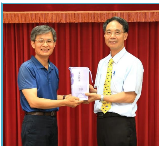
廉政署南部地區調查組與本所互贈 機關紀念品