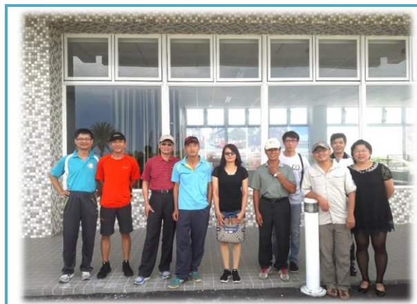
大鵬灣公園環境教育合影

大鵬灣濕地公園環境教育之行，出發囉！今年度起，「環境教育」列入公務人員每個人每年必須完成 10 小時終身學習課程。目的是希望能從公務人員做起，促進國人能有良好的環境保護觀念，使大家重視環保，也是環境教育法制定的立意。今年本場在大鵬灣國家風景區濕地公園舉辦環境教育，一方面讓同仁更了解工作地附近的生態樣貌，實際走訪，體認環境保