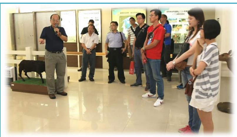
廉政署南部地區調查組參觀本所陳列室