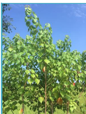
綠意盎然的烏柏！

烏柏是本場常見的植物之一，其為落葉喬木，高可達15公尺，無毛，具乳狀汁，樹皮灰黑色，有縱裂。烏柏被視為經濟作物而栽種已有千年歷史，主要因其種子外部含蠟，可作為蠟燭。種子本身含油，可作為肥皂原料。而葉子亦可為中藥。此外，烏柏木材密緻，易於加工，為家具及雕刻良品。由於秋季葉片能變色，目前常作為觀賞植物，本場的烏柏葉子正在變色，煞是好看！