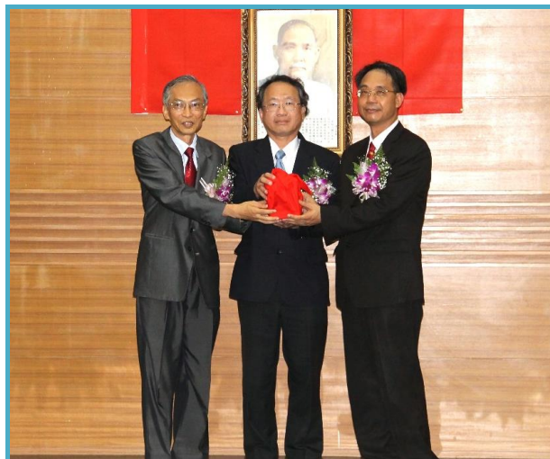
新（卸）任所長交接印信

黃所長以「團隊合作、跨域價值」、「產業所需、長在我心」及「強本出擊、走向國際」三個面向與同仁分享，希望同仁與產業站在一起，將產業的需求，永遠放在心上，參考目前與各友單位成功合作的經驗，為產業解決問題、貢獻心力，例如今年成立的豬隻育成輔導團隊，即動用了全國所有可用的資源，期