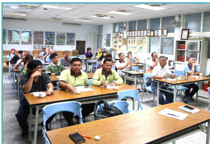
踴躍參加研討會的農戶們！

本場科技系於9月20日在吉安鄉干城活動中心舉辦家禽飼養管理學術研討會，邀請到中央畜產會家禽課卓達仁課長來講授家禽保健與管理；花蓮縣動植物防疫所動物防疫股林國棟股長講解臺灣禽流感疫情現況與防疫政策；本場蘇安國場長暢談養雞飼料與飼養；以及本場洪兮雯助理研究員和大家分享丹麥雞