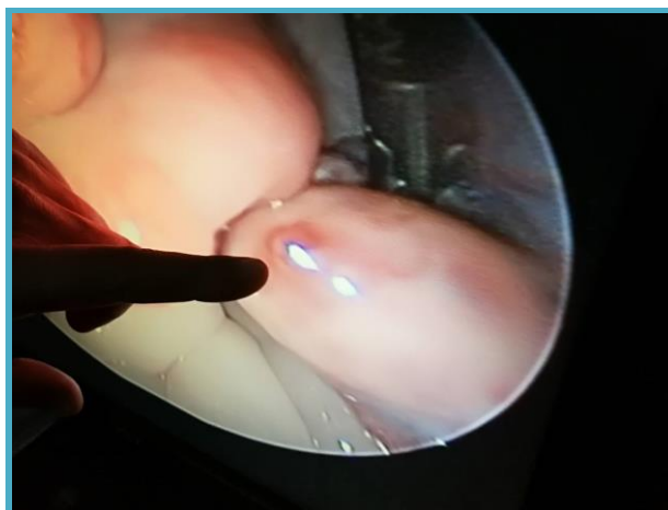
羊隻卵巢上的排卵點確認