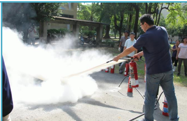
滅火器的使用及實際滅火演練

消防防護演練於下午兩點正式開始，加工組全體同仁準時於加工館3樓會議室就坐完畢。首先觀看地震避難影片，在生動活潑及實例講解的影片中讓同仁了解正確地避難方式，接著就實地操作地震避難演練，大家屈身躲入堅固的掩