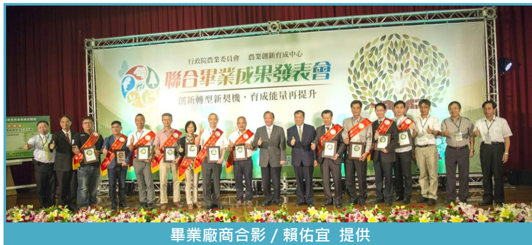
畢業廠商合影

聯合畢業成果發表會，由林聰賢主任委員頒發本年度 11 家進駐廠商育成畢業證書，其中 5 家為本所業