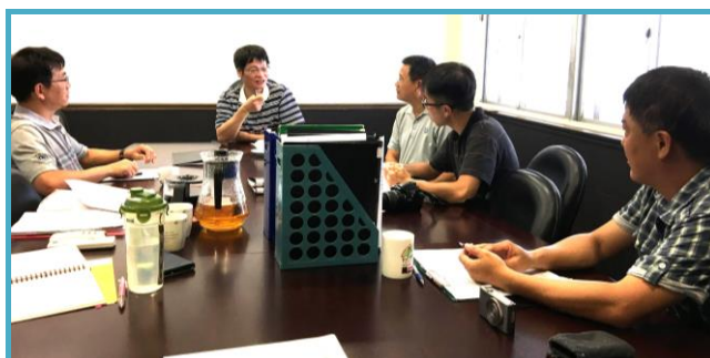
小型豬疾病監控內部控制稽核

首先由本場畜產科技系章嘉潔主任說明臺東場家畜疾病監控內部控制及稽核計畫執行情形，稽核委員針對本