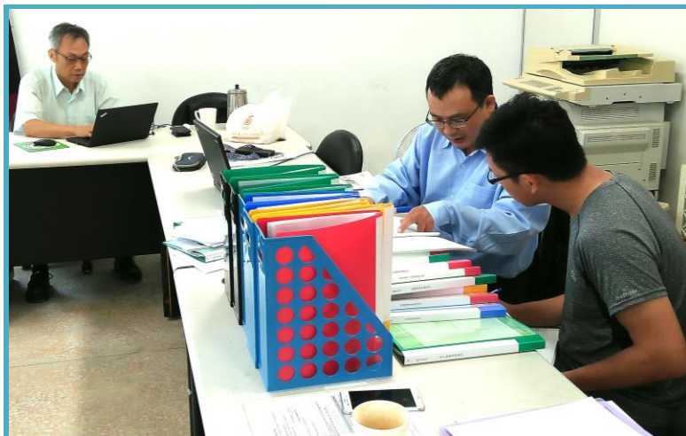
106 年度 MD 鴨群 ISO 9001：2015 新版認證稽核情形

分所的最少疾病番鴨族群（MD 番鴨）主要用於供應生醫產業所需之清淨胚蛋及試驗用雛鴨，是國內目前清淨鴨群之一，亦為本分所主要之特色鴨種。為使生產流程與銷售服務更符合現代化品質管理，自 2014 年起，即將該族群之使用、管理和銷售導入 ISO 9001 管理系統。本（106）年度起因應 ISO 9001:2015 改版，MD 番鴨的生產於 9 月 26