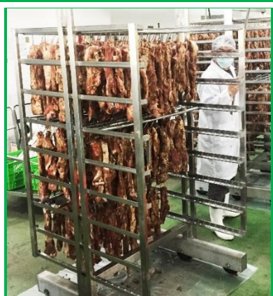
熱門的春節肉製品－臘肉

春節肉製品包含貢丸、香腸、熱狗及臘肉。製作良好的貢丸，其水分及油脂的保留性良好，口感有彈性，同仁們還開玩笑說或許能當桌球打呢！本組的香腸用酒不手軟，不管是材料攪打、香腸充填還是包裝，每個步驟都聞得到明顯酒香，是個讓人食慾全開的產品特色。相較於市售熱狗，本組熱狗除了香料及必須添加劑之外，其配方皆以原料肉為主。剛蒸煮出來熱騰騰的熱狗，肉香十足、口感細緻有彈性，吃一口便顛覆以往對熱狗的印象。臘肉以整塊豬五花肉為原料，配合獨特配方醃漬製作。醃製完畢後再以進口燻材煙燻增添風味。相較於傳統產品，