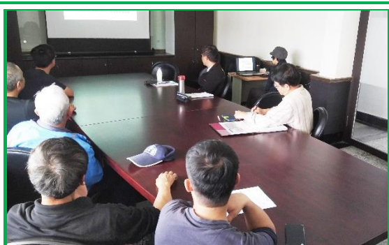
餵飼管理教育訓練

豬隻成長各階段之營養需求及餵食量均有所不同，且本場飼養之蘭嶼豬，作為研究與醫療用途，更是需要明確規範餵飼量，使其能健康的成長，並讓每頭豬的體重