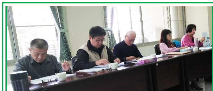
種原組計畫審查，委員們鉅細靡遺的檢視計畫內容