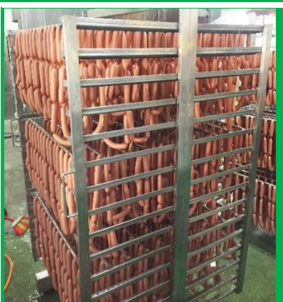
真材實料的春節肉製品－ 熱狗

今年第一次參加本組的春節肉製品製作，親友們很好奇這些肉製品好吃的秘訣。反覆思考後，筆者總結成三句話：新鮮原料、用料單純、講究製程。新鮮的豬肉每週分批送入加工廠，過程嚴控溫度避免反覆結凍，藉此達到確保衛生及維持肉質口感之目的。肉製品配方傳承多年，是加工組肉製品特色來源之一，精算各種香料以調整風味，並適度使用添加劑以確保產品安全。相較於市售產品，加工組肉製品的添加物較單純且原料肉比例較高，不但吃起來更安心且肉味十足。而在生產製程方面，對於產品安全衛生、外觀及口感影響甚大。製作人員全程穿戴口罩、手套、頭帽及實驗衣。此外，每日工作結束，實驗衣都會重新清洗，以避免食材被污染。很多程序都會監控溫度並計時，以確保產品安全衛生及口感，若是溫度與攪打時間不當，可能造成產品外觀塌陷及軟、爛、粉的不良口感。