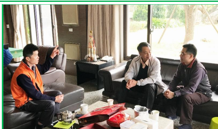
許成寶場主（左）向黃所長（中）及蕭分所長（右）說明牧場經營現況

黃所長參訪後，指示目前臺灣的乳牛場在場域設備及牛隻飼養品質皆不輸國外，期許酪農朋友再精進，因為乳牛產業經營不易，酪農一天從早忙到晚，如何善用科技，達到省工省時的目的。酪農在經營管理上若需要本所協助，所裡一定全力支援，做為酪農朋友強力後盾。在此感謝黃所長對乳牛產業的支持，本所與分所同仁將繼續努力為乳牛產業打拼，成為產業重要基石。