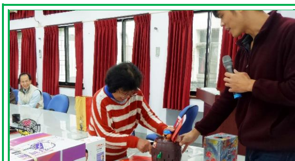
宜蘭分所同仁參與尾牙摸彩同樂之歡樂氣氛

尾牙餐會從滿桌豐盛的佳餚開啟序幕，由於同仁們平日較少有齊聚一堂的場合，在享用著滿桌佳餚與閒話家常之餘，因繁雜工作而緊繃的情緒得以稍作緩解。劉分所長首先在餐會上向同仁們致意，感謝同仁們一年來的辛勞付出；接著由筆者為同仁帶來古典吉他演奏，曲目分別為「Romance De Amor」、「楊柳」、「Tango en skai」及「Recuerdos de La Alhambra」；緊接著開始尾牙摸彩，正式進入年終尾牙活動的高潮。今年的尾牙摸彩程序有點複雜，除了人人有獎的刮