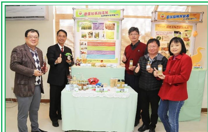
106 年度新化地區年終記者會本組展出蘆粟牧草產品大成功

牧草」、「牧草甘蔗」之稱的蘆粟牧草，格外受到記者矚目。經過筆者 2 年精心的研究，開發出利用天然方法萃取甜蘆粟糖液的加工技術，優質的甜蘆粟糖漿呈現琥珀色，富含葡萄糖、果糖及寡糖等營養元素，特殊的風味並不遜於進口的楓糖漿，是一種前途看好的健康糖品。記者會當日現場展出許多利用甜蘆粟糖汁所開發出