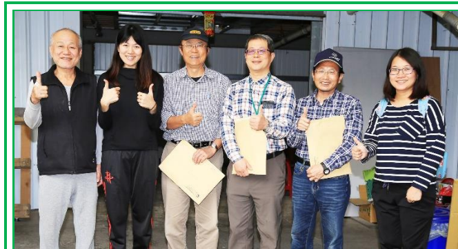
輔導團隊訪視健安畜牧場

專家，會議中同樣先安排洪小姐說明場內經營狀況、預期輔導項目及需陪伴師與輔導員們協助的工作，整場輔導工作在和諧的氣氛中圓滿完成。