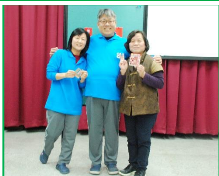
林場長與兩位賓果遊戲冠軍合影，大方送出紅包