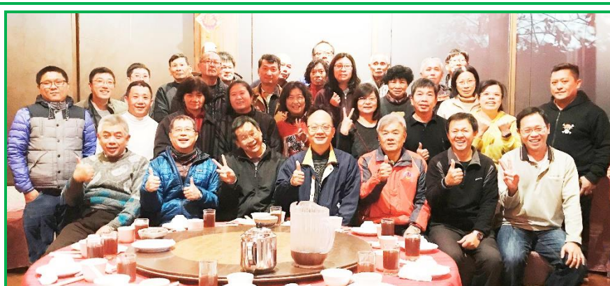
產業組告別金雞喜迎狗年感恩尾牙宴

，大家圍坐在一起，啖美食談天說地，好心情全寫在臉上，除了肚子吃飽飽，心裡也暖暖的，正式告別金雞年，歡喜迎狗年，也祝福大家狗年運勢旺旺旺，工作順順順，同仁們平平安安健康康。