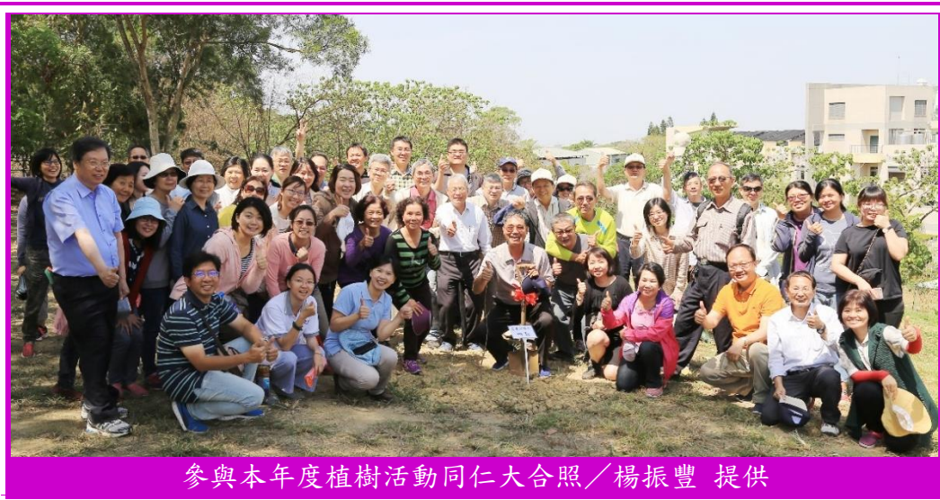
參與本年度植樹活動同仁大合照

本所綠美化小組之後也將陸續在單身宿舍後方坡地拓植草皮進行綠化。在水土保持局臺南分局最近