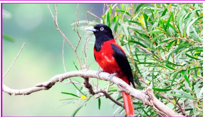
縣鳥現身~

這次出場的是具有最美麗的鳥種之稱的花蓮縣縣鳥—朱鸛。棲息於低海拔丘陵地之闊樹林地帶，大多於樹冠層活動，較少到樹林下層和地面，飛行時呈波浪狀曲線前進。朱鸛的最大特色為其「紅水黑大扮」的亮麗羽色，雄鳥由頭至頸、上胸中央及翼為黑色；背至尾羽、胸側、下胸以下皆為鮮朱紅色，雌鳥大致與雄鳥相同，僅在胸腹處有白棕相間的斑點。另一特色為其變化豐富的鳴叫聲，有時似貓叫，有時像笛音，以及繁殖期特有的“wu wu”