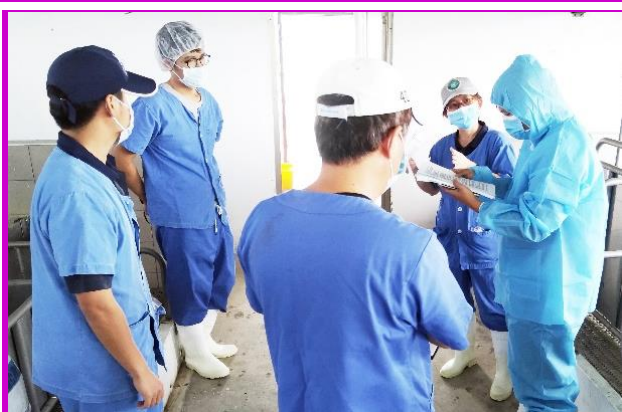
臺東縣防疫所人員至豬舍現場查核

在AAALAC續評認證輔導才剛過不到一週的時間，緊接著就是農委會的實驗動物現場實地查核，於4月24日由臺東縣動物防疫所動物保護檢查員至本場查核，其不只是至豬舍現場檢視畜舍及豬隻狀況，亦詢問許多現場飼養管理、去勢操作等相關問題，最後也察看了水質檢測、動物治療紀錄、試驗計畫書等各種書面資料，整個過程認真嚴謹。所幸AAALAC的複評輔導剛過，本場已先做過許多相應的整理與準備，