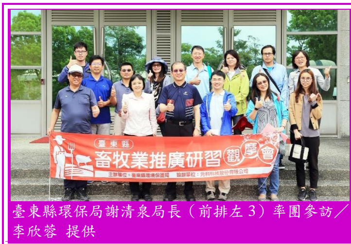
臺東縣環保局謝清泉局長（前排左3）率團參訪

臺東縣環境保護局辦理臺東縣畜牧業推廣研習觀摩會，4月10日上午由臺東縣環保局謝清泉局長率團參訪本所沼液沼渣施灌及產業組一股廢水處理場。