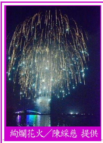
絢爛花火／陳綵慈 提供

4 月 19 日 2018 澎湖國際海上花火節於馬公市觀音亭休閒園區由四架經國號戰機衝場後盛大揭幕，今年活動主軸為「璀璨澎湖，閃耀世界」，活動除每週一、四於觀音亭休閒園區舉辦之固定場次外，另有 6 場於其他五鄉施放，活動預定於 6 月 21 日閉幕，想體驗菊島的風光水色、迷人的海上花火節、肥美的海鮮與濃濃的人情味嗎？馬上訂張機票來場澎湖之旅吧！