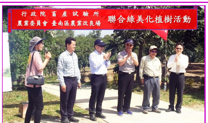
植樹活動長官致詞

一年一度的植樹活動於4月9日舉行，地點位於本所與南改場之交接處，是一個視野良好的小山坡。當天天氣晴朗，風景怡人。許多單位參加者也都提前到場享受美好環境。活動之前，大夥兒在附近聊天巡視，談談以前植樹活動的趣聞，看看那些植株是否安好，彷彿連同記憶一起種下，在數年之後的今天開花結果，品味著過往的回憶，卻增添了幾分春天的清新。活動開始首先由