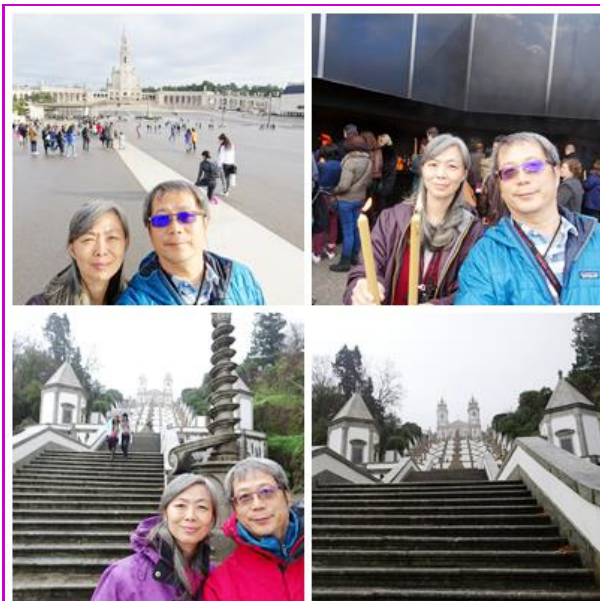
上圖為法蒂瑪燒蠟燭祈福，下圖為仁慈耶穌朝聖所

徒把蠟燭燒掉，我們當然也不能免俗在這朝聖地燒蠟燭為親友祈福。仁慈耶穌朝聖所位於布拉加(Braga)郊外的山上，被公認為葡萄牙最美麗的教堂，外型獨特“之字型”的階梯一路延伸到116公尺高山丘上的教堂，不論你從上往下看或從下往上看這些階梯，無法看出其中豐富的細節，每一段階梯的旁邊是一個小堂，每個小堂裡面擺著聖經裡的主題，階梯中間都有個小噴水池，每個造型據說是依照人的五種感覺，視覺、嗅覺、聽覺、觸覺、味覺為主題，噴泉有的從眼睛、耳朵、鼻子、嘴巴等湧出泉水，主要是淨化信徒的心靈；我們心無旁騖上上下下這116層階梯，藉此沉澱及淨化我們忙、盲、茫的心靈。(下期待續)