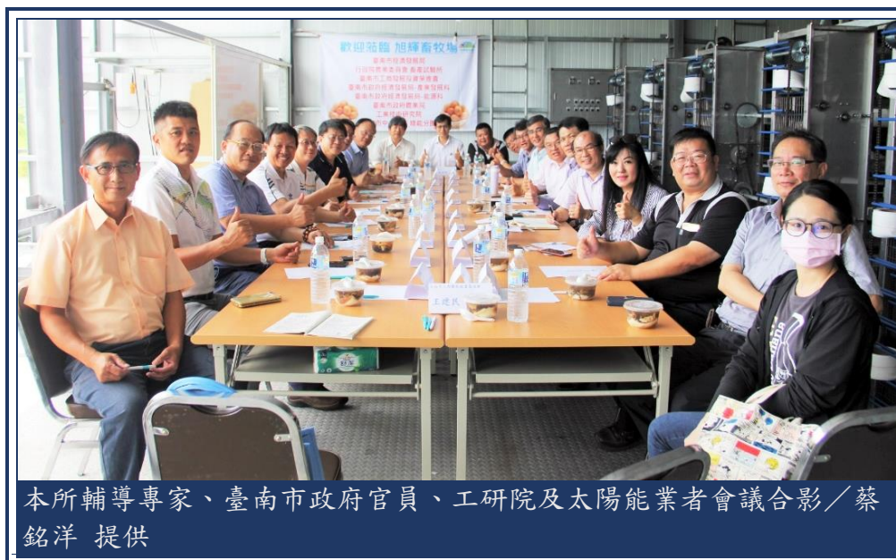
本所輔導專家、臺南市政府官員、工研院及太陽能業者會議合影

防範禽流感病毒威脅，運用畜試白絲羽烏骨雞飼養及產蛋之生產技術，未來將生產特色化畜試白絲羽烏骨雞蛋，創造自有品牌。也期許將來可以配合政府新南向