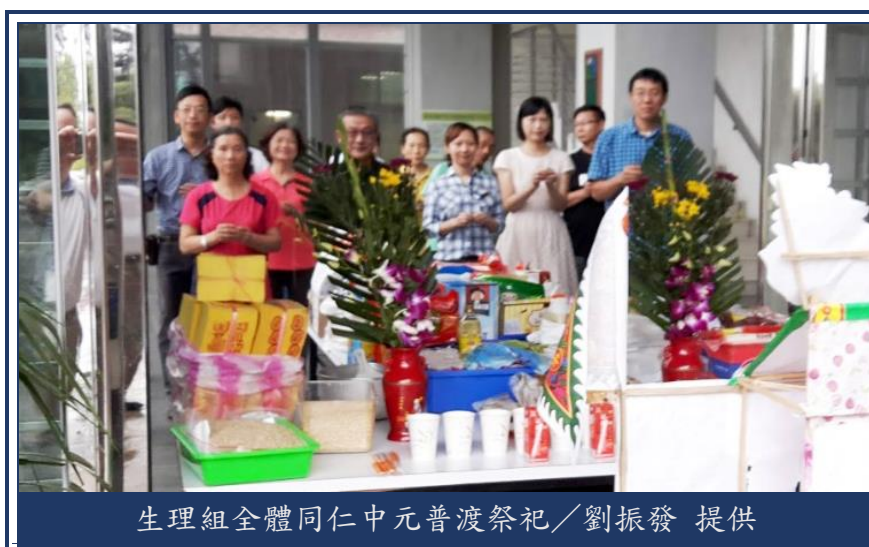
生理組全體同仁中元普渡祭祀

農曆七月是一年一度好兄弟放假的日子，是道教俗稱的「鬼月」，亦為佛教的「慈悲月」。本組依例在農曆七月時選擇所有同仁均在勤的時間，遵照傳統習俗舉行祭拜祈福儀式。今年是選在國曆 8 月 28 日