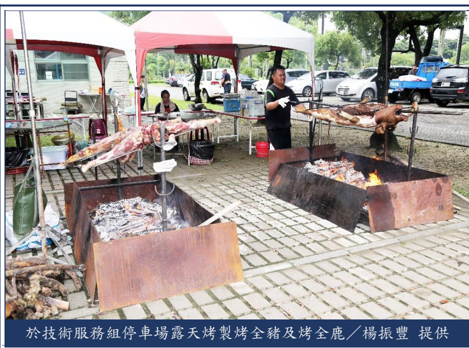
於技術服務組停車場露天烤製烤全豬及烤全鹿

本活動聚集本所特色動物品種及加工產品，並邀請歷任所長、副所長及主任秘書回所共襄盛舉。高雄種畜繁殖場聘請烤全豬與石板烤肉專家，以畜試黑豬、高畜黑豬、高肉質黑豬和臺灣水鹿等優質品種，製作出汁多味美的烤全豬、烤全鹿和石板烤肉料理。