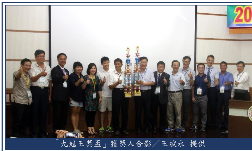
「九冠王獎盃」獲獎人合影

場，除品種改良外，尚須面臨經營效率與落實防疫上的生物安全管理及永續發展循環利用等課題，藉此研討會達到對養豬體系相關技術有更深入的交流與合作共識，以