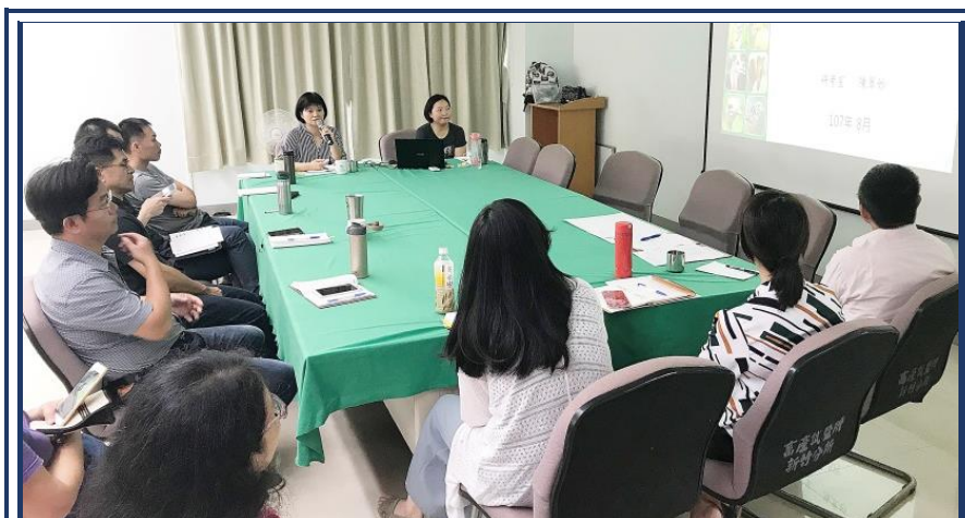
內部控制業務說明會

陳翠妙研究員則說明內部控制特性及研究經費，在內部控制特性方面，說明為何及如何進行自行評估與內部稽核，內控基本觀念架構大同小異，主要取決於