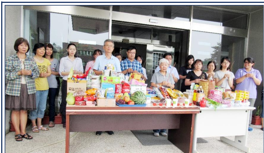
營養組同仁中元普渡拜拜

本組承襲舊有的習俗每年於農曆七月間擇日進行中元普渡，今年於8月30日下午1時30分舉行中元祭拜儀式。因連日來南部地區大雨不斷，深怕雨勢過大而影響中元普渡，儀式當日上午依舊大雨滂沱，眼看雨勢未歇，深怕人員及供品淋濕，原已有延緩準備，幸好在祭拜開始前雨勢暫時變小，於是同仁們便開始