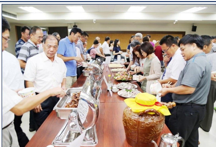
六十週年所慶畜產加工品評會

此外，高雄場還提供價值不菲的鹿茸彩蛋，讓人眼睛為之一亮；產三股協助提供黑鵝雞（黑羽烏骨雞）與黑鵝雞蛋（青殼蛋），而花蓮種畜繁殖場及宜蘭分所亦盛情贊助烤鬥雞母和鴨翅冷滷，讓品評會增添不少美味家禽產品。本組亦特地準備製作精良的肉品及蛋品加工產