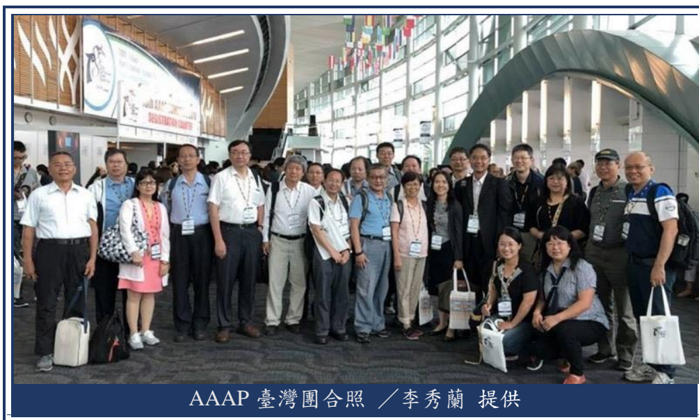
AAAP 臺灣團合照

2018 年 8 月 1 日至 4 日於馬來西亞古晉舉辦之第 18 屆亞澳畜產大會（AAAP），本場張伸彰主任、筆者及同仁一同發表近期研究成果。本次大會來自亞洲及澳洲等國 600 多位專家學者，共發表高達 499 篇研究報告，大會舉辦相當成功。本