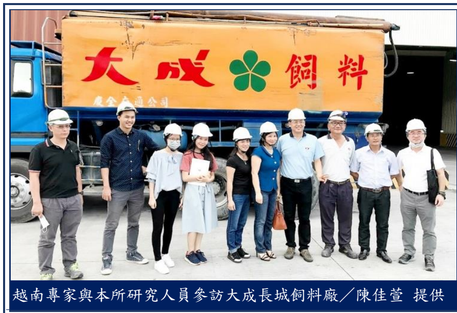
越南專家與本所研究人員參訪大成長城飼料廠

園區的飼料廠，公司還特別買了臺灣著名的波霸奶茶給與會貴賓嚐鮮，聽取公司簡報後，大家戴起安全帽到廠房參觀，外賓對於臺灣對廢棄物資源再利用與先進的生產飼料品管監控系統都讚不絕口，期望未來雙方有合作機會。