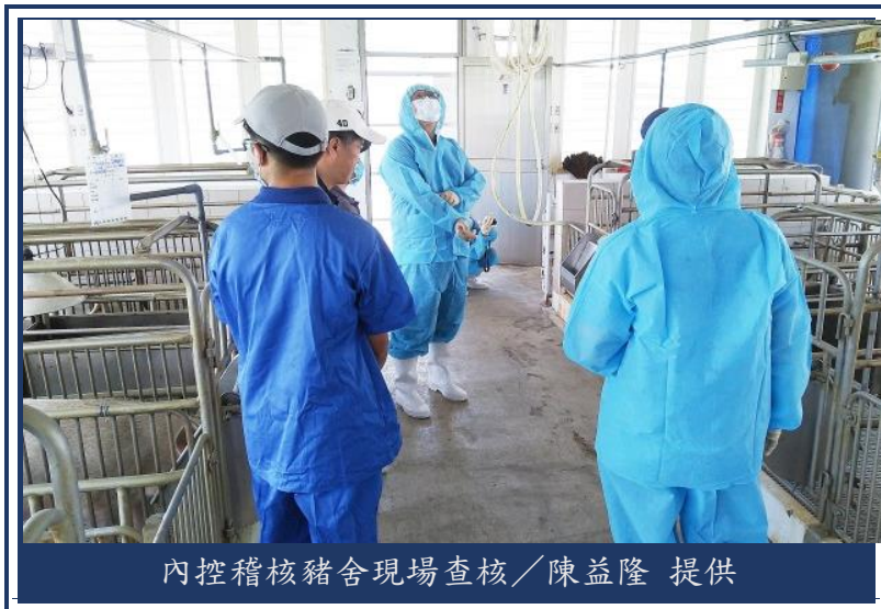
內控稽核豬舍現場查核

稽核小組的成員們一到本場禮貌性寒暄後，就開始鉅細靡遺地翻閱起桌上的備審資料，其中還好幾次索取補充資料，在查看的過程中也分享許多各場的狀況，以及從本場的資料中看到的問題，一起拿出來討論，整個過程認真但又不會太過嚴肅，三位委員都有非常紮實的基礎與豐富的實務經驗，對於本場一些現場管理及表格的呈現方式，提供許多實用的建議及作法。