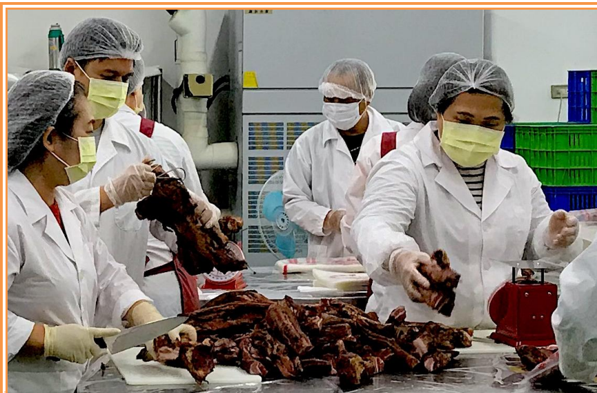
進行肉製品包裝

同心協力並分工合作才有辦法達成，為如期完成春節肉製品製作，自去(107)年12月中起至今年1月底止，同仁每日一上班即全副武裝赴肉品加工廠趕工。雖然近年老師傅相繼退休，職員也有所變動，但大家仍謹記前輩的教誨，無論機械操作技巧、工作時程、人力分配及新血的訓練等，大多都能順利傳承。另外，