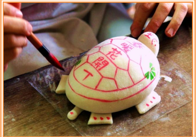
肪片龜 DIY

澎湖人的農曆過年有別於臺灣本島，最熱鬧的時節不是除夕到初五這幾天的年假，而是農曆元月十五日元宵節的前後幾日。各大廟宇都會辦理乞龜活動，乞求平安、健康與財富，製作龜的材料往往讓人大吃一驚，從傳統的肪片龜、黃金龜、米龜，演變至金錢龜、果凍龜、黑糖糕龜、海菜龜、麵線龜及高麗菜龜等，都令筆者嘖嘖稱奇。乞龜的規則是向神明稟明欲祈求案上陳列物，並說明目的及隔年加值還願物，若取得「聖筊」，即可帶回，保佑未來一年工作順利、身體健康。並於隔年元宵節前，將加了心願的物品送回廟中，以感謝神明整年的照顧。