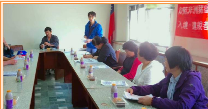
本場派員宣導非洲豬瘟防疫

本場於1月10日至新城秀林地地區農會參加新城鄉毛豬產銷班第一班1月份班會，會中輔導班員各項政府政策，有關廚餘轉用飼料所需參考配方之提供、飼料配方調整服務、或改養其他豬品種與豬隻飼養遭遇問題諮詢，另如有命名規劃意願之種公豬也可申請冷凍精液製作及保存。各豬場使用廚餘前須向環保單位報備核准，依廢棄物清理法相關規定，廚餘餵飼豬隻再利用者，應通過再利用檢核，並以高溫蒸煮，維持中心溫度90℃以上、至少1小時以上。本次會議除了9位產銷班員出席外，新秀地區農會及新城鄉公所也派業務單位代表出席，而廚餘養豬轉用飼料及非洲豬瘟防疫的工作攸關每位班員自身經營的事業，均願意配合政府政策，共同做好非洲豬瘟防疫。