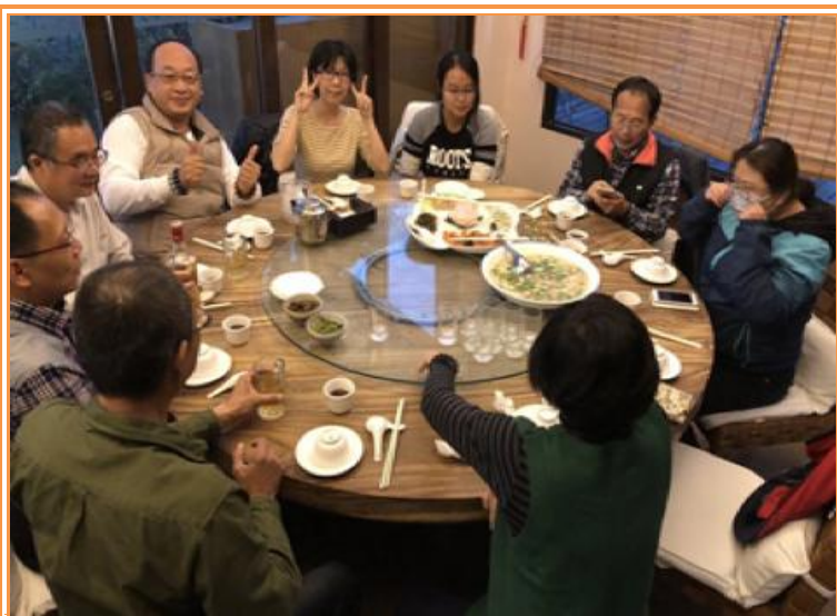
葉陶楊坊餐宴會場

1 月 17 日晚上正是那個溫馨的夜晚，林組長感謝同仁一年的付出，本組在人力不足及分攤工作的情況下完成平時業務職掌外，仍能獨力完成上級長官交付的 3 場「臺越」、「臺美」及「臺英」國際研討會，且研討會一場較一場盛大，