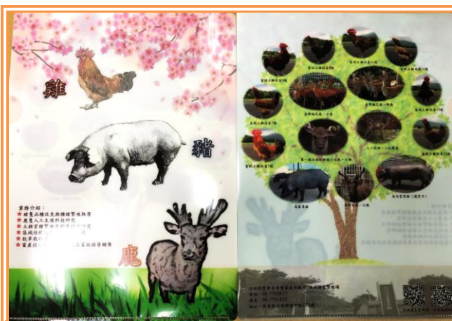
本場限定-超聰明資料夾

最近大家都忙著把一整年的工作做完美的結束，又要迎接新的挑戰，這時候可說是每年的“工作更年期”，不過也因為如此，長官們就會趁機來犒賞員工，請吃飯順便聊聊天，慰勞一年的辛勞。