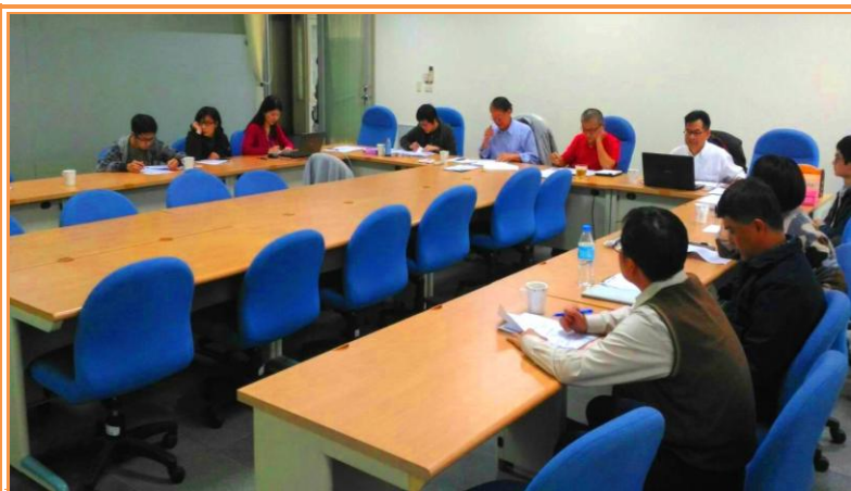
109 年度科技計畫先期構想審查會議

場、恆春分所及本組共計研提 7 題，其中 2 題為延續 108 年的科技計畫，其餘為新提計畫。各題計畫經計畫主持人口頭簡報後，由各位委員提問審查，並對計畫構想內容提供諸多修改意見及寶貴建議，於同日中午 12 時 30 分左右順利完成審查。