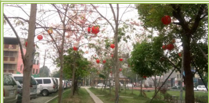
武德殿前廣場栽種整排花旗木

春天是花開的季節，漫步欣賞盛開的花木，是多麼浪漫的一件事！這種賞心悅目的情境，在臺南新化就可以讓您一飽眼福。此美景位於新化老街南側的武德殿前廣場，緣起於一年多前，當地的民宿業者發願認養栽種整排花旗木，因氣候合宜、生長良