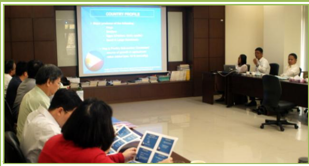
座談會意見交流