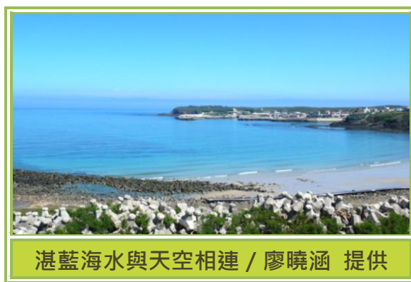
湛藍海水與天空相連

為宣揚澎湖海洋文化，使大眾對澎湖的海洋及人文特色有更深刻的認識與肯定，澎湖縣政府將海上長泳活動訂為澎湖縣每年重要大事。泳渡距離分為 500(體驗組)、2,000(挑戰組)及 5,000(泳渡組)公尺，距離雖不是很長，但由於離岸較遠，加上海流的不規則，因此，被長泳專家譽為臺灣最刺激、挑戰長度最長的海泳，目前僅次於菲律賓卡拉莫安國家公園的海泳。熱愛挑戰泳渡的同仁們，是否已蠢蠢欲動了呢？