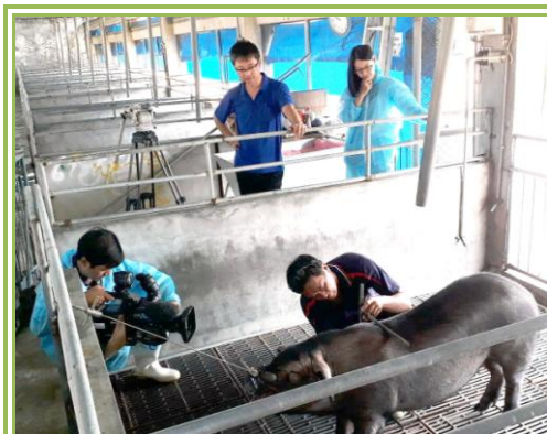
豬隻性能檢定示範之側拍紀錄

本場於2月20日接受公共電視文化事業基金會「我們的島」專訪，希望製作有關臺灣黑豬產業以及豬種保種、育種歷史的專題報導，讓消費者對具臺灣本土特色的黑豬有進一步的認識，由文字記者陳寧小姐與攝影記者葉鎮中先生進行採訪。當日由許晉賓場長簡