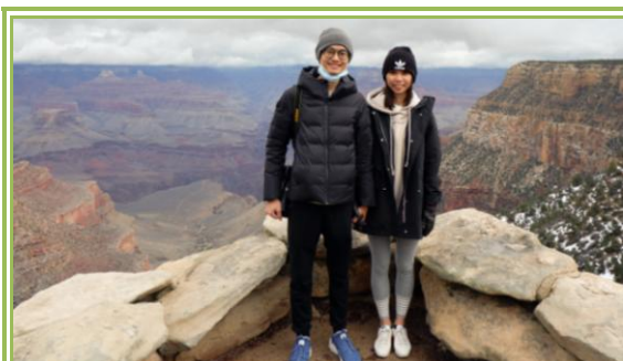
大峽谷國家公園合影

此次的美國蜜月自由行，因美國地廣人稀，所以我們毫不猶豫的選擇自駕。大峽谷國家公園(Grand Canyon National Park)為我們此次探訪的景點之一，其位於美國西岸的亞利桑那州(Arizona)，走向為東西向，總長度約 350 公里，寬度僅約 20 公里。我們一路從洛杉磯開往大峽谷，開了約 1,000 公里，體驗到氣溫的劇烈變化，從 15°C 降至約 0°C。臺灣因緯度較低，3 月份氣候宜人，然大峽谷海拔雖僅有 2,000 多公尺高，但因緯度較高的關係，溫度逼近零