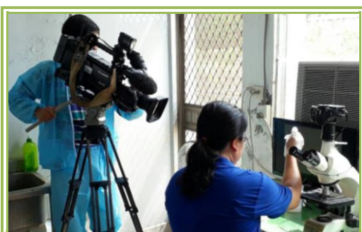
精液鏡檢操作之側拍紀錄

介目前所飼養的桃園豬、梅山豬、高畜黑豬及高肉質黑豬等豬種，接續講解公豬採精、精液鏡檢及豬隻性能檢定等專業技術，讓一般民眾可以清楚了解研究人員對於黑豬育種的努力。