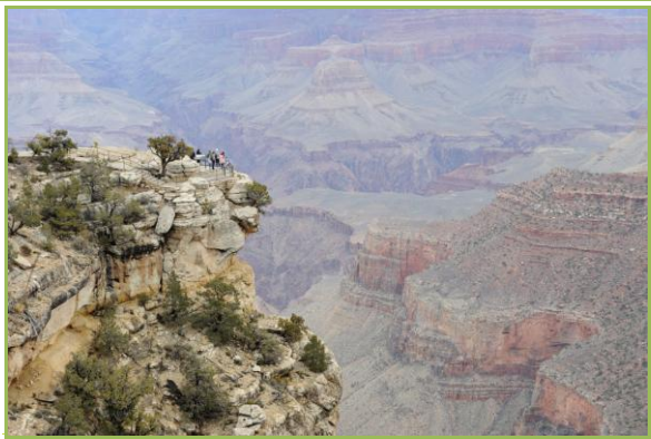
位於大峽谷上端鳥瞰居高臨下的美景

度。隨著海拔的增加，沿途可見路邊小小片積雪，抵達山頂時還下起了大雪。當時天氣不佳，除了下雪、下雨外還起了大霧，能見度僅約 5~10 公尺，看不到任何東西，雖然早上太陽露了小臉，然而陽光很不給力，無法有效驅散濃霧。沙漠觀景點(Desert view point)是大峽谷南緣最東邊的景點，有個著名的觀景台可看到壯觀的峽谷面貌。當時風大且下著小雨，我們冒著寒風刺骨及雨水洗禮走向觀景台，就當我們踏上觀景台的瞬間，一道陽光從雲中竄出，那種撥雲見日的感覺真的非常感動！終於在沙漠觀景點看到壯