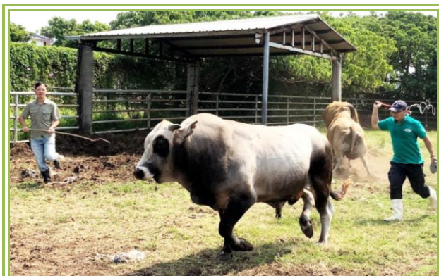
新牛仔吳志華助理研究員(左)與許佳憲副研究員(右)趕牛英姿

為了要把種公牛從牛舍趕到作業欄內，筆者跟著牠們的腳步前進時，發生一段小插曲，往前跑的牛隻突然調頭，往筆者迎面奔來，天啊！筆者驚嚇大叫「牠往回跑了！」，此時吳助理研究員快速回防、奮力一擊把牛隻趕回跑道，真是驚險刺激！趕牛秀第一階段在李主任指導下，順利地讓種公牛進到作業欄內。第二階段必須把部分牛隻趕回大溪放牧區，此時5虎將發揮他們平日的絕佳默契，早已就定位站在路口維護車輛及牛隻安全，並