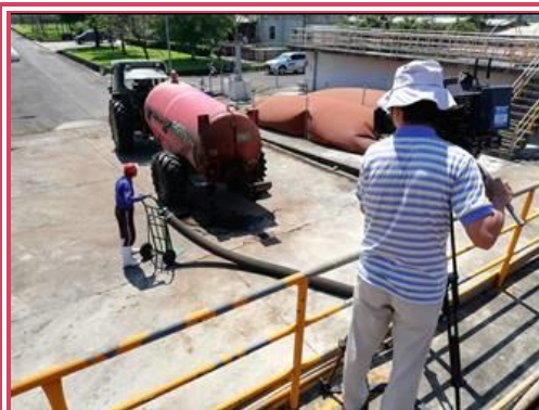
公視記者拍攝本所施灌槽車接取養牛厭氣廢水畫面

應用；接著再由本所雙蕭二將—蕭宗法研究員與蕭庭訓組長分別就沼氣發電與直立式發酵槽沼氣增生術，闡述畜牧廢水加值效益；最後，在飼作組與產業組的協助下，依序拍攝槽車載運養牛廢水施灌盤固草、