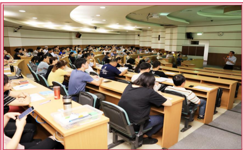
職業安全在職訓練授課情形

本所由秘書室推動職業安全衛生工作將屆滿 3 年，為強化所內各現場監督管理人員、單位職安窗口及本所各單位職安委員（含勞工代表）之維護職場安全意識，特別規劃於 4 月 24 日上午 9 時在技術服務組 2 樓視聽室，委由社團法人中華民國工業安全