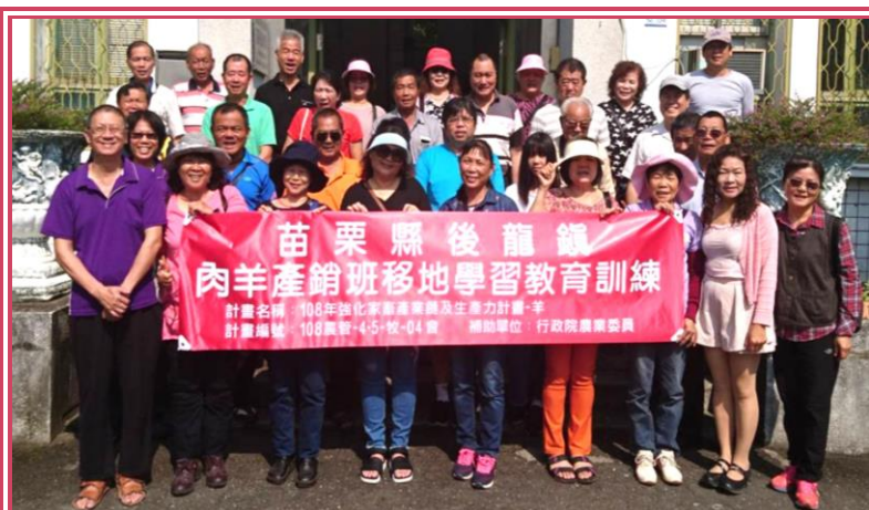
苗栗縣後龍鎮肉羊產銷班教育訓練合照

行政院農業委員會補助苗栗縣後龍鎮肉羊產銷班移地學習教育訓練，4月22日來到本場參觀，筆者首先向班員們宣導非洲豬瘟的防疫工作，再由畜產經營系莊璧華主任解說本場目前研究方向及工作情形，讓班員了解品種保存及育種的重要性。