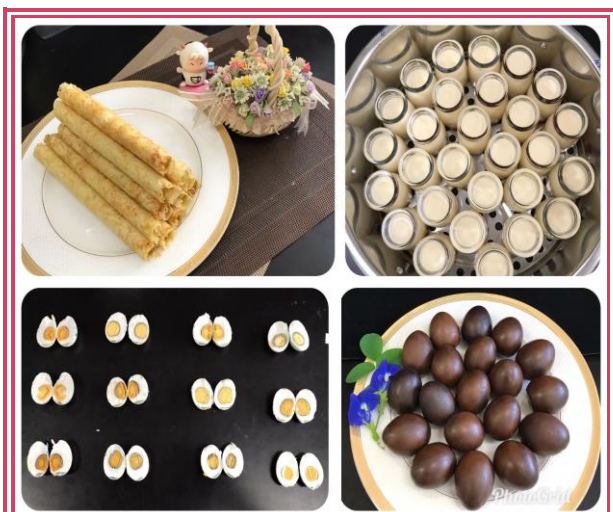
試製蛋加工品

組和諧的工作氛圍，讓筆者得以開心享受工作中的樂趣，每每看到大家試吃筆者試做的蛋品所給予的回饋，都好開心，正向回饋讓人有成就感，負向回饋提供了具體再改進與調整的方向，並積極再進一步研究。