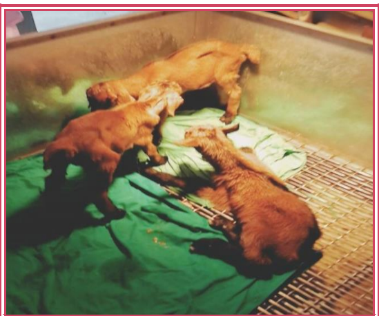
剛出生的可愛羊寶寶

因此，於本月初開始就特別注重代理孕羊的營養需求及產前照顧。另外也針對將出生的小羊準備舒適又安全的「仔羊車」。而代理孕羊於4月24日出現分娩徵兆，於是聯絡產業組一股李佳蓉獸醫師至場內就診，經評估後必須剖腹生產，遂於下午進行剖腹產手術，產出2頭仔羊，且母子均安。另一頭代理孕羊於4月28日早上自然產出體重達4.8公斤的仔羊，真的是很大隻喔！本次冷凍羊胚的腹腔鏡移置，終於在多方面的關注下順利產出羊寶寶。