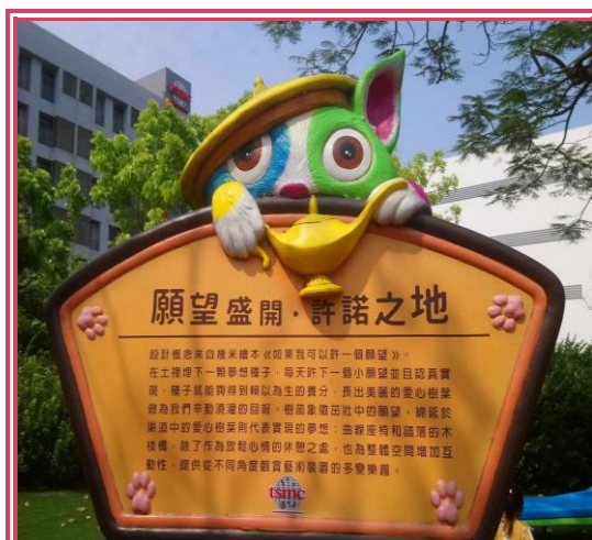
南科湖濱雅舍幾米主題公園一隅

算一算來臺南工作已經快 7 個年頭，聽說臺南美食和景點很多，但卻很少聽人提起「樹谷園區」，一直以來的印象停留在科技園區裡面應該是工廠林立、烏煙排放、空氣很糟等，沒事不會想去的地方。這次剛好小朋友學校辦理戶外教學，地點竟然挑選在「樹谷園區」，而且簡介中還說明裡面有科學館、農場等，因此帶著好奇心和小朋友一起報名參加。當天搭著遊覽車，車子開在國道 8 號上，心裡突然有個疑問，好不容易要請假休息，怎麼又要把筆