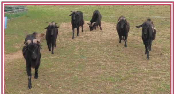
本站保種公山羊

本站自從離島離牧計畫開始後，就沒有養豬的研究業務，僅剩牛羊飼養研究業務。筆者幾天前甫接獲長官指示——代理澎湖工作站主任的業務，現在已懷著緊張、期待又害怕的心情踏上了澎湖這塊土地，聽著技工蔡武瑜先生一一細數本站的歷史。在這之前，筆者的人生僅有一次因為工作的關係短暫一天來回澎湖，筆者的緊張來自於對陌生環境的未知，也期待著要好好認識這個只有在小時候聽過外婆澎湖灣的地方。但其實最害怕的是把3個嗷嗷待哺的小孩丟給老婆自己照顧，老婆憤而丟予休書一封(開玩笑的啦！)。最後，希望在這代理澎湖工作站主任業務的期間，請大家多多指教囉！