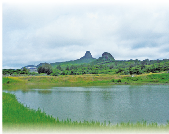
分所農塘具灌溉、滯洪與防洪多種效益，於7月30日進行改善工程

有鑑於當前環境氣候變遷加劇，行政院農業委員會水土保持局總局與臺南分局多年來持續編列經費，協助分所山區牧路修護、攔水壩整建及農塘改善工程。多年來承該局協助，陸續進行環山牧路、野溪改善及農塘護堤修建等工程。分所既有農塘泥沙淤積嚴重，影響蓄排水及防洪效益，且各個農塘間既有溢洪道及出水口涵管年久失修，今為延長農塘壽命及增加蓄水量，水保局臺南分局數月來密集與分所研商規劃改善工程，目前已完成發包作業。今年擬修繕舊有溢洪道、碎石步道，並在第四池增設滯洪池以減少雨季之水土沖刷及增加蓄水量，美化農塘周邊植生環境。本工程因農塘鄰近新建羊舍預定地，故將配合新建羊舍做整體規劃，預留水保環評相應之洩水道等設施，期望改善後之農塘與新建羊舍設施，其周遭能夠煥然一新，改造舊有羊舍之面貌，而以園區的型態呈現在大家眼前。