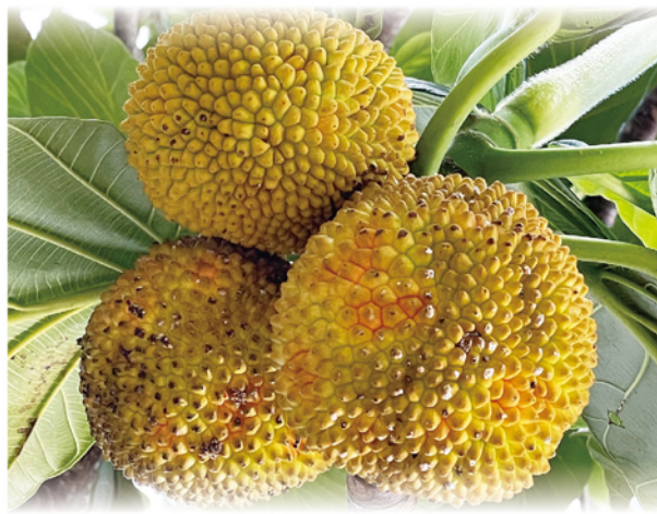
花蓮場麵包樹於 7 月 6 日結出成熟的「巴吉魯」

本場側門附近有著一棵非常高的麵包樹，在夏初時抬頭可以見到它的球狀果實，外型就像小顆的波羅蜜，擁有黃中帶橘的外表，阿美族語稱呼其為「巴吉魯」，也就是麵包果，是花蓮特有食材之一。據美國農業部數據顯示，麵包果的鉀含量豐富，是同為高鉀水果「香蕉」的 10 倍，每 220 公克的麵包果，就有約 1 碗飯的碳水化合物含量。麵包果在 6 至 9 月時落果，生長條件好的話，成熟果實可重達 3.2 公斤，夏季時都會看到在地同仁煮麵包果湯，先將麵包果去皮、去心，果肉煮得幾近爛熟，加點小魚乾，水滾後兩分鐘調味即可上桌。果肉中橘紅色的部分就是被假種皮包裹住的核仁，可以將其分離出來烤、炸、炒、煮，味道與口感都很像花生，十分適合下午當作零嘴解饞。