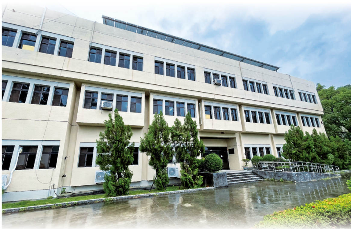
8 月 5 日大雨中的經營館，周圍地面濕滑，走過路過小心慢行，安全至上

國內 COVID-19 疫情暫時緩解，中央疫情指揮中心自 7 月 27 日起解除全國疫情三級警戒，降至二級警戒。用於區隔本組分區辦公環境的臨時防疫隔離路線牆被移除，遠在標準豬舍辦公的同仁亦陸續搬回經營組，分隔兩地的職員終於再相遇，溝通與合作更加明快順暢。家中有小朋友的同仁也終於鬆一口氣，不用再請假照顧或想盡辦法安置。後疫情時代，線上會議更加頻繁，一個月前訂下的研習課程亦陸續展開，職員參與循環農業與資通訊概論等相關課程，以利後續研究工作。另一方面，也默默籌備養豬場節水減廢再利用研習課程，預期能幫養豬廢水輔導團的團員補充相關知識大補帖，以助相關業務順利進行。適逢西南氣流盛行的季節，也要提醒大家，近期連日的大雨造成經營館周圍地面濕滑、青苔橫行，請走過路過小心慢行，安全至上。