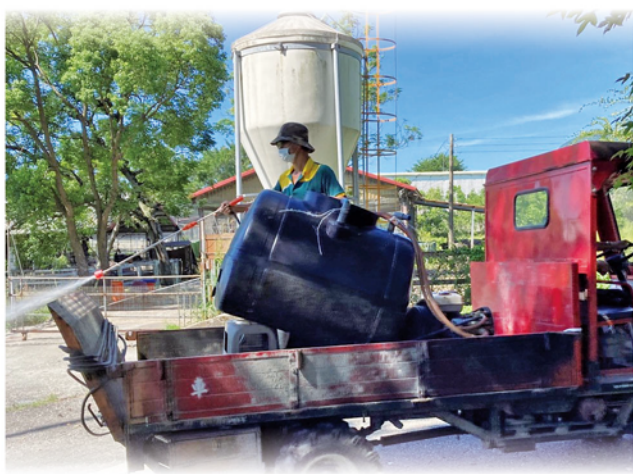
花蓮場於 7 月 1 日進行場區內環境消毒

在疫情嚴峻的時刻，本場於 7 月 1 日進行場內之戶外環境消毒。消毒作業為兩人一組，一人負責駕駛，一人於搬運車上以高壓水槍噴灑稀釋消毒水。由